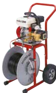
KJ-2200 Кат. № 63877, 63882