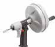
Ручная вертушка Kwik-Spin с AUTOFEED® 41348