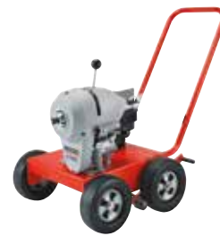
K-1500G 44587, 48462