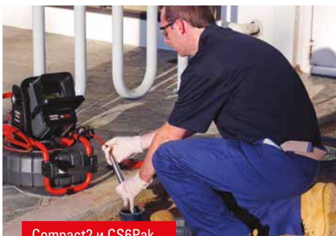
Compact2 и CS6Pak