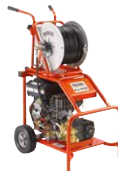
KJ-3100 Кат. № 37413