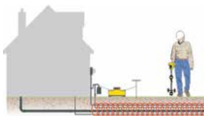
Прямое подключение к инженерным сетям