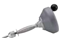
Ручная вертушка K-25 58890 / 58895

Какая бы машина вам не понадобилась для прочистки трубопроводов, вы найдете подходящую модель RIDGID. Начиная с портативных ручных прочистных машин и до машин барабанного типа, секционных, стержневых и гидродинамических прочистных машин, вы можете быть уверены, что среди продукции RIDGID найдете подходящий инструмент и дополнительные принадлежности для вашей конкретной работы.