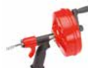
Power Spin с AUTOFEED® 41408