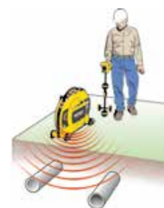
Наведение сигнала для определения положения инженерных сетей