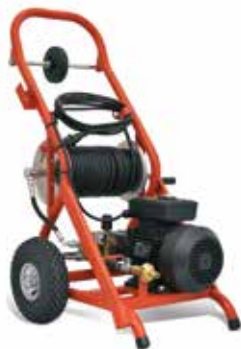
KJ-1590 II Кат. № 35511