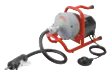
K-40 71742 (230 В) / 71717 (110 В)