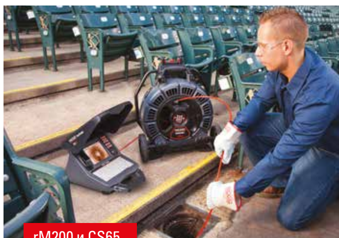
rM200 и CS65